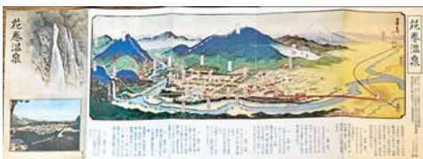
⑥【常光鳥瞰図】花巻温泉 13×35 昭和6年 6,600円