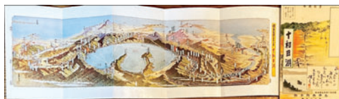
⑭【常光鳥瞰図】十和田湖 15×44 書簡図絵 昭和7年 5,500円