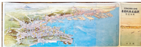
⑯【常光鳥瞰図】昭和八年特別大演習 観艦式参列将士 歓迎記念 15×46 横浜市 昭和8年 11,000円