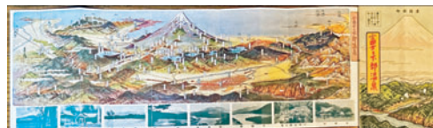
⑮【常光鳥瞰図】富士と下部温泉 15×43 書簡図絵 山梨県庁 戦前 8,800円