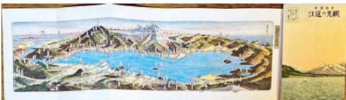
⑬【常光鳥瞰図】観光の近江 15×44 書簡図絵 滋賀県庁庶務課 昭和8年 5,500円