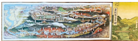
③【常光鳥瞰図】奥利根温泉郷 15×42 日本名所図絵社 昭和6年 5,500円